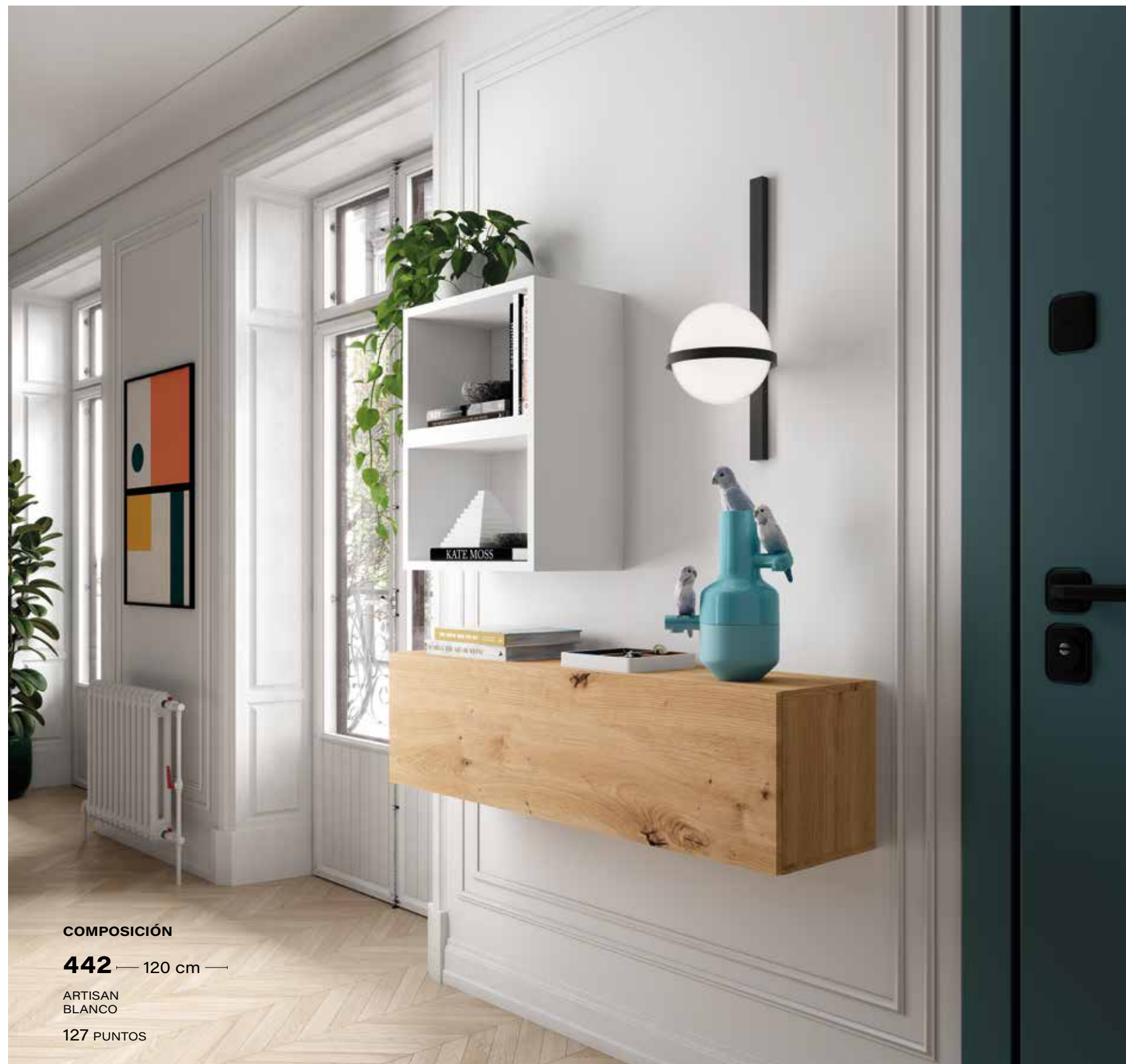
COMPOSICIÓN 442 — 120 cm — ARTISAN BLANCO 127 PUNTOS