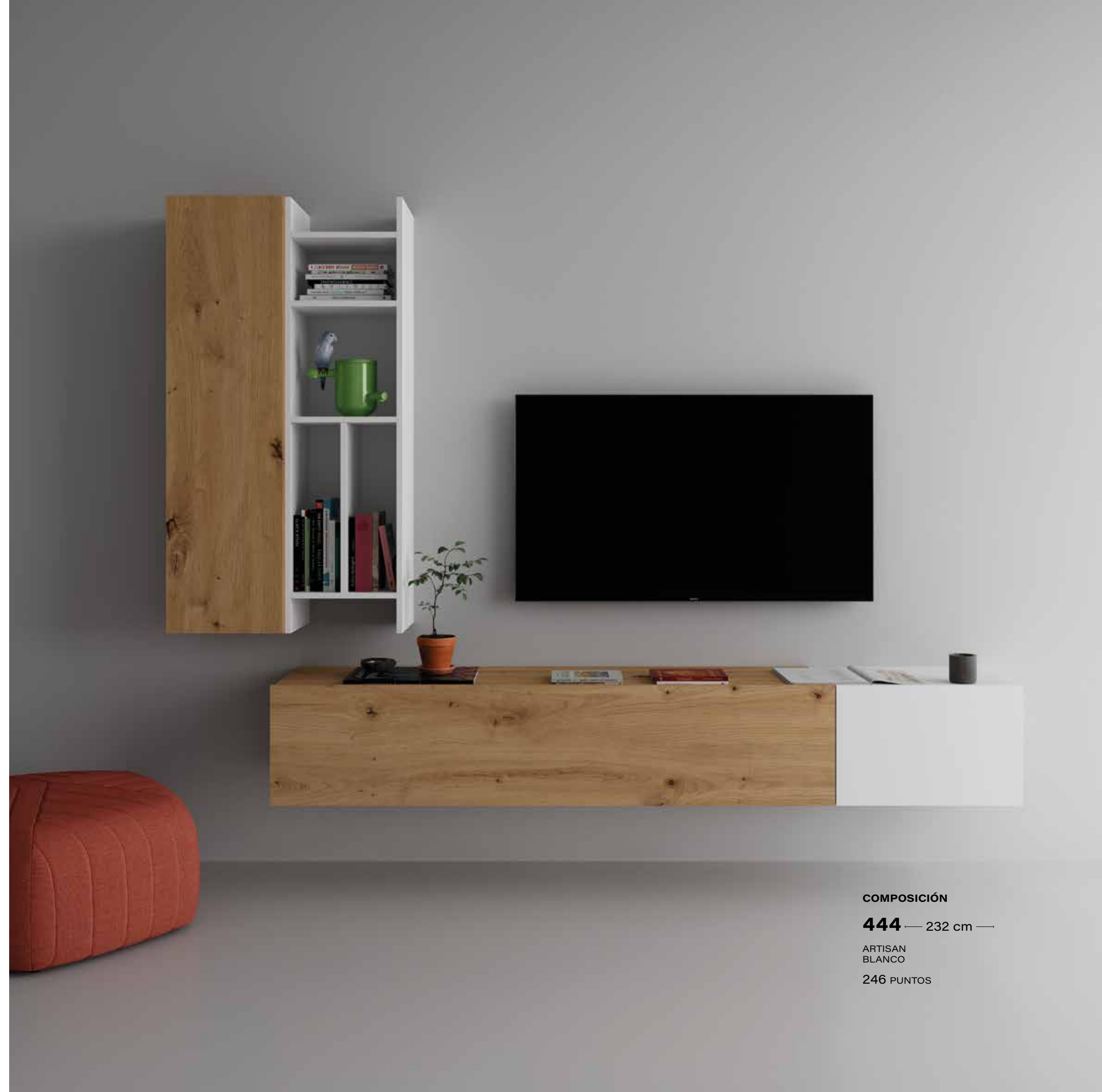
COMPOSICIÓN 444 — 232 cm — ARTISAN BLANCO 246 PUNTOS